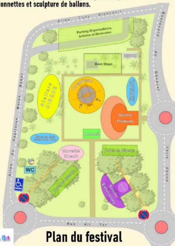
Plan du festival